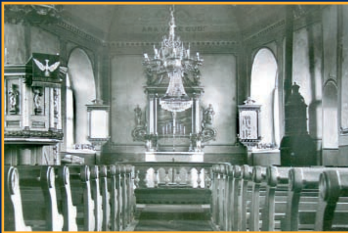
Äldre interiörbild från Eskilsäters kyrka. Bänkarna utbyttes på 1950-talet.

Närheten till Västergötland förklarar de tidiga stenkyrkorna. Under senare tid har en romansk stenkyrka med absid konstaterats vid arkeologisk undersökning på Lurö. Ön ligger i Väner, halvvägs till Västergötland från Värmlandsnäs räknat, och är förknippad med traditioner om kloster. Stråket över Väner och Lurö har tidigt haft betydelse, även under medeltiden som led för pilgrimer som färdades till och från norska Nidaros/Trondheim.