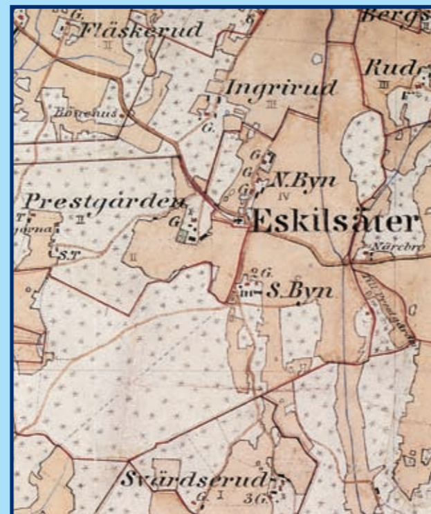
Detalj av konceptblad till ekonomisk karta, uppmätt 1883-1895. Kartan visar kyrkan mellan N Byn och S Byn. Prästgården ligger rakt väster om kyrkan.