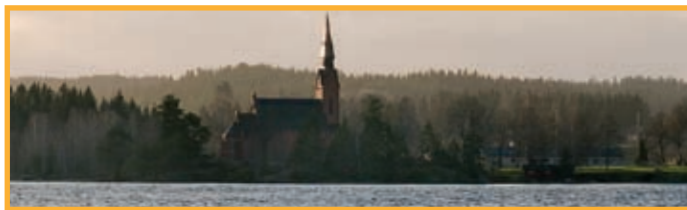
Den 25 januari 1225 passerade norske kungen Hákon Hákonsson Ny kyrka med sin krigshär på flera tusen man. Från Kongsvinger följde man sjösystemens isar över Eda ner mot Arvika, Älgå och Glava.

Kulturspridningen följde människornas vägval på vatten och land. Samma väg kom också kristendomen. Kyrksöckerna uppträder från 1200-talet som pärlor på de trådar som kommunikationslederna utgör.