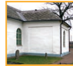
Sakristian på kyrkans sydsida byggdes under perioden 1650 - 1680 som ett gravkor i två våningar. Det nedre planet användes som gravkor och den övre delen gjordes till en herrskapsläktare med valv ut mot kyrkorummet.

Dagens kyrka i Eskilsäter är vitputsad under valmat sadeltak med skiffer och består av ett rektangulärt långhus med tresidigt avslutat korparti. På sydsidan finns ett gravkor som numera fungerar som sakristia. Tornets nedre del är från medeltiden. Tornet fick sitt nuvarande utseende 1896 då den övre delen byggdes och försågs med klockformad huv och åttakantig öppen lanternin som avslutas i en spira med kula och kors.